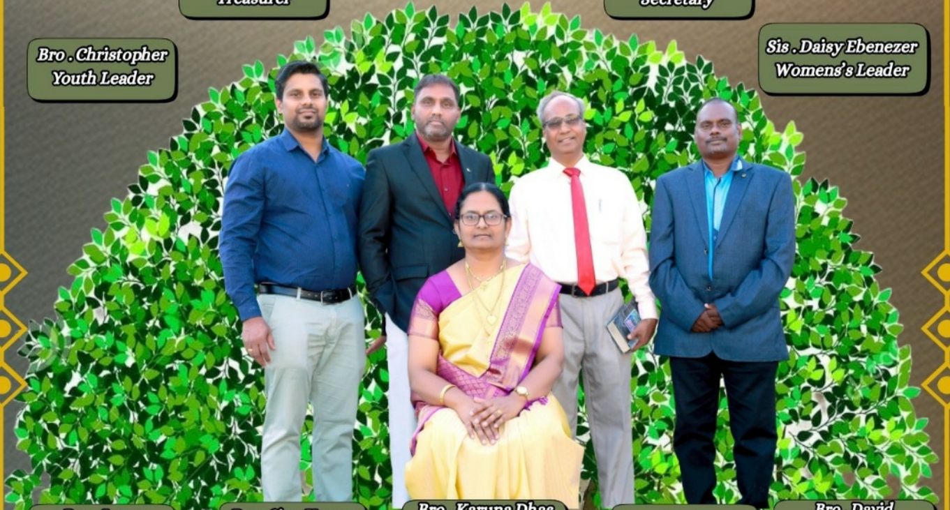
Bro . Jagan Magazine Ministry